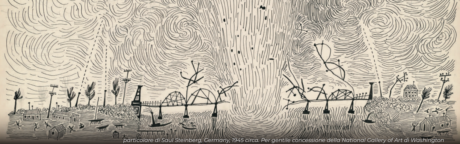
particolare di Saul Steinberg, Germany, 1945 circa. Per gentile concessione della National Gallery of Art di Washington