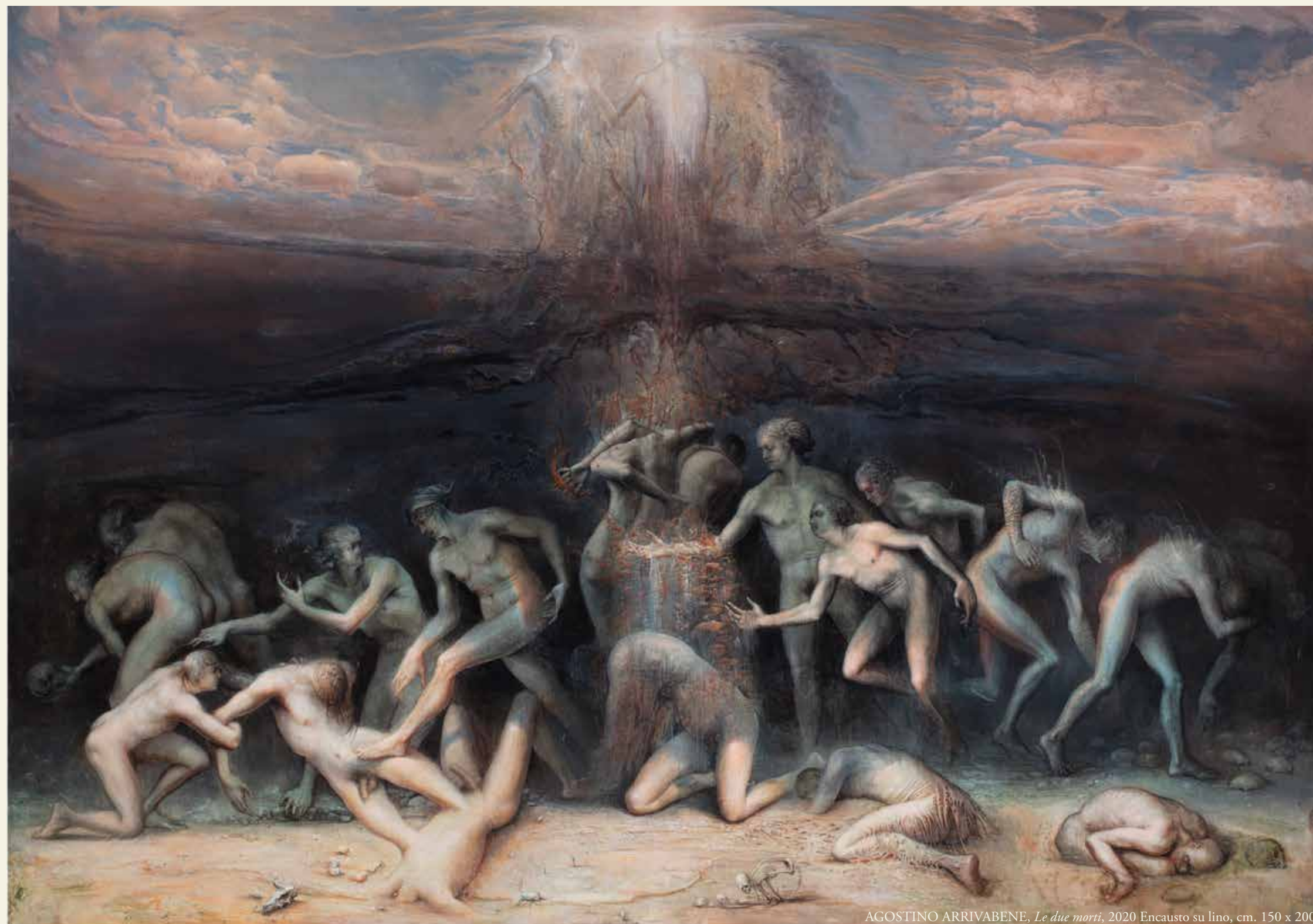
AGOSTINO ARRIVABENE, Le due morti , 2020 Encausto su lino, cm. 150 x 200